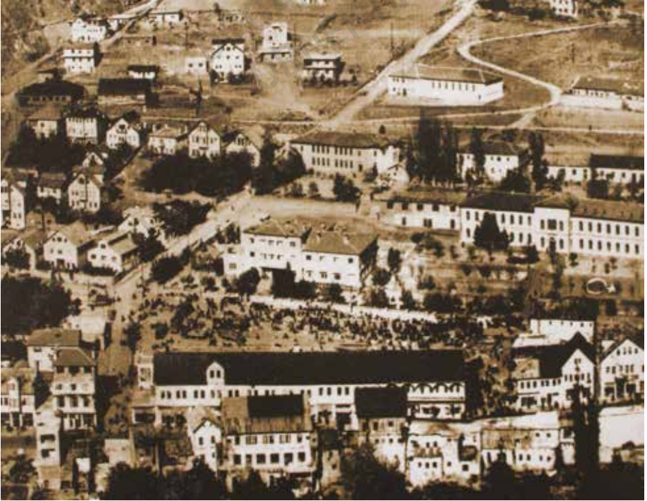
Bahçe içindeki konaklarıyla Gümüşhane, 1941

Bugünkü şehir merkezi diğer Anadolu şehirlerinden farklı değil. Apartmanlar arasında sıkışıp kalmış birkaç konak haricinde eskiye dair pek bir iz yok.